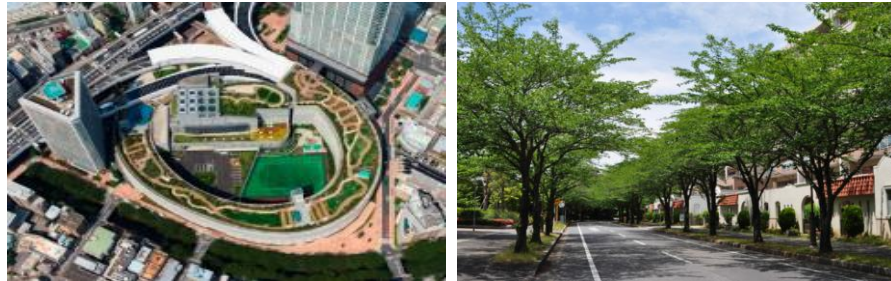
立体都市公園の整備