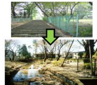
河川と公園との一体的な再整備