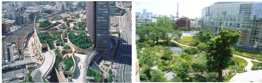
民間建築物等の敷地内緑化