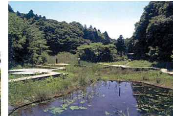
都市に残された緑地の保全